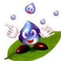
豊田市水道キャラクター 「ぴっちゃん」