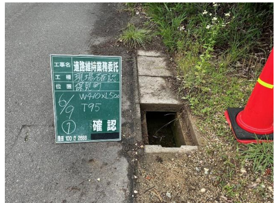
鋼製側溝蓋盗難状況