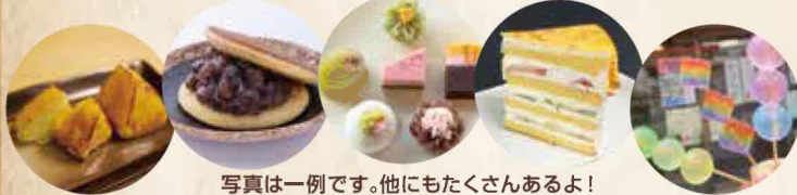
写真は一例です。他にもたくさんあるよ!

会場 A 「豊田プレミアムスイーツクラブ」各店による こだわりスイーツを販売! (参加店は裏面参照)