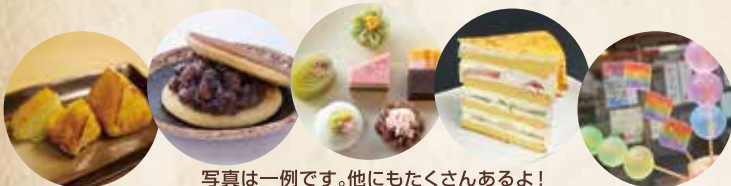
写真は一例です。他にもたくさんあるよ!

会場A 「豊田プレミアムスイーツクラブ」各店による こだわりスイーツを販売! (参加店は裏面参照)