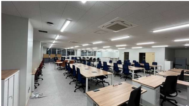
職員室 フリーアドレス化し、コミュニケーションを促進する。