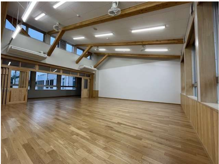
左：普通教室前面 右：普通教室背面 ホワイトボード壁を採用し、多彩な授業に対応する。