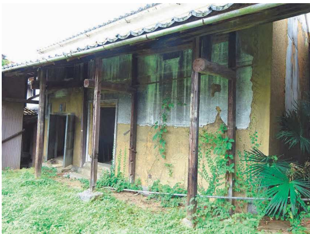
調査建物【蔵3】外観写真