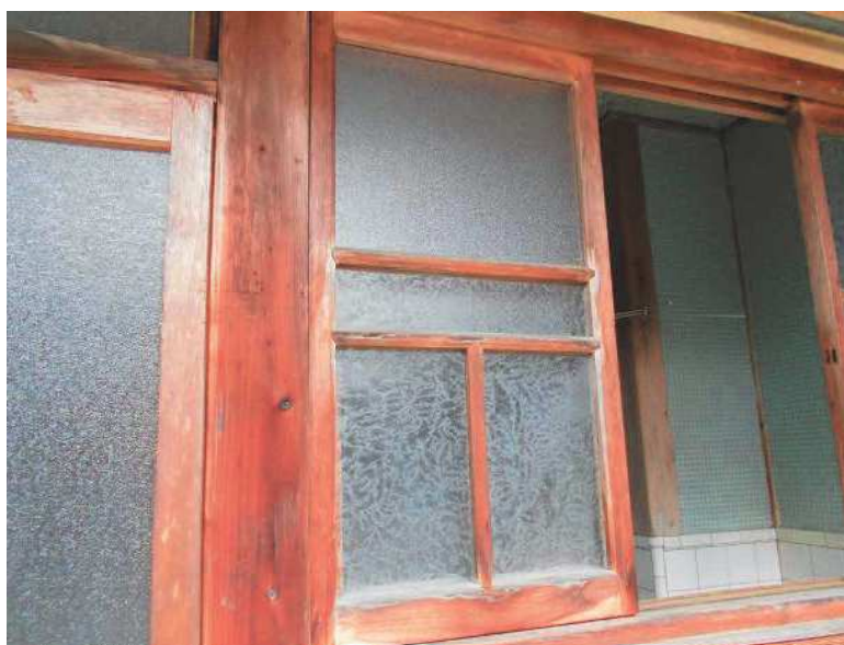
NO. 3 撮影日：令和4年6月12日

釜場踏込 竹格子、簾子付下見板張り 水屋と主屋取合いについては 主屋柱に水屋の桁が掛かっている 。