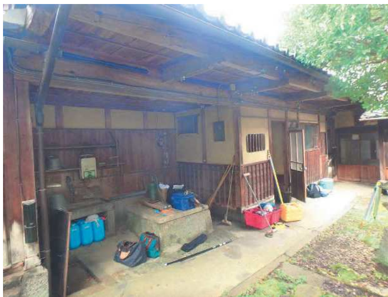
NO. 1 撮影日：令和4年6月12日