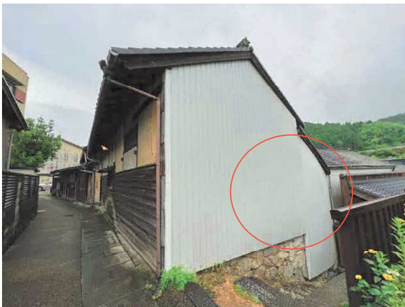
写真No11 撮影日：2022年7月4日