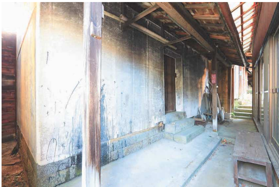
調査建物【蔵2】外観写真