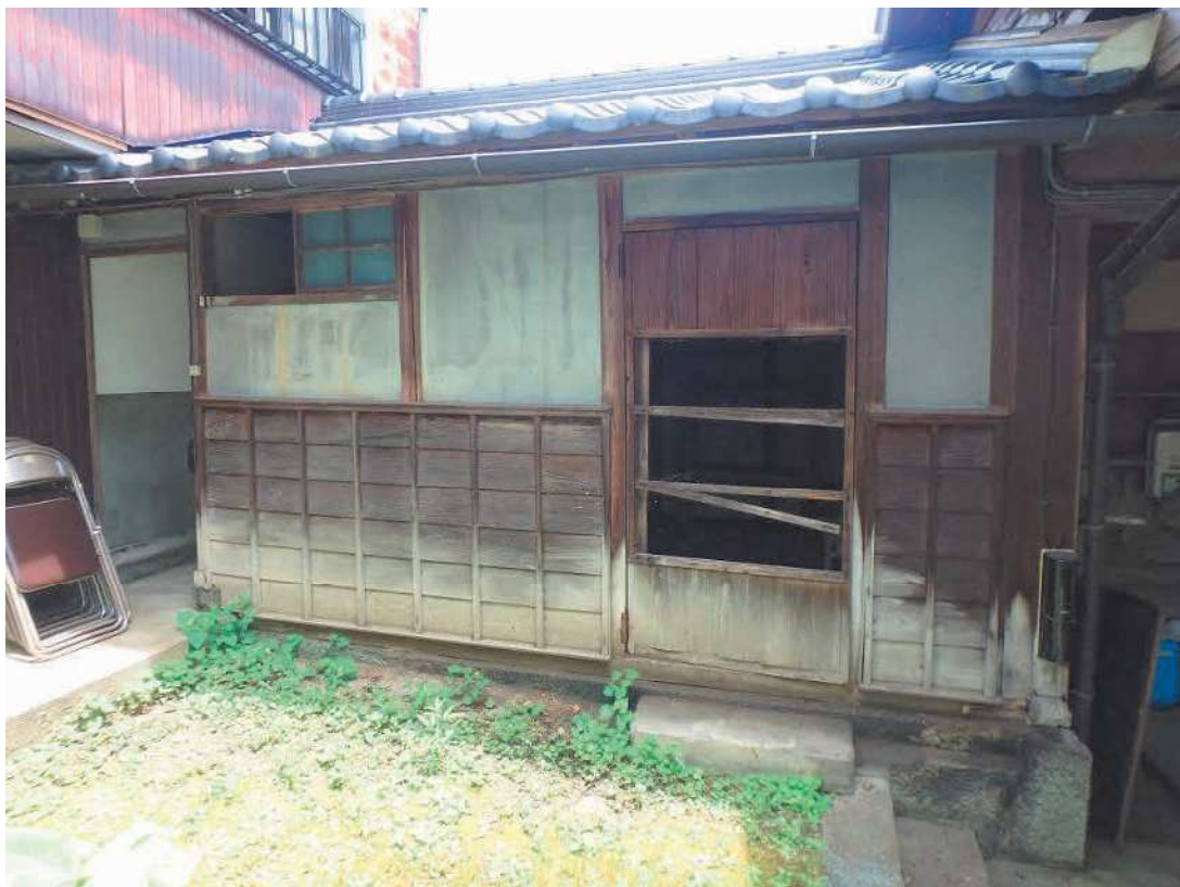
調査建物【納戸】外観写真