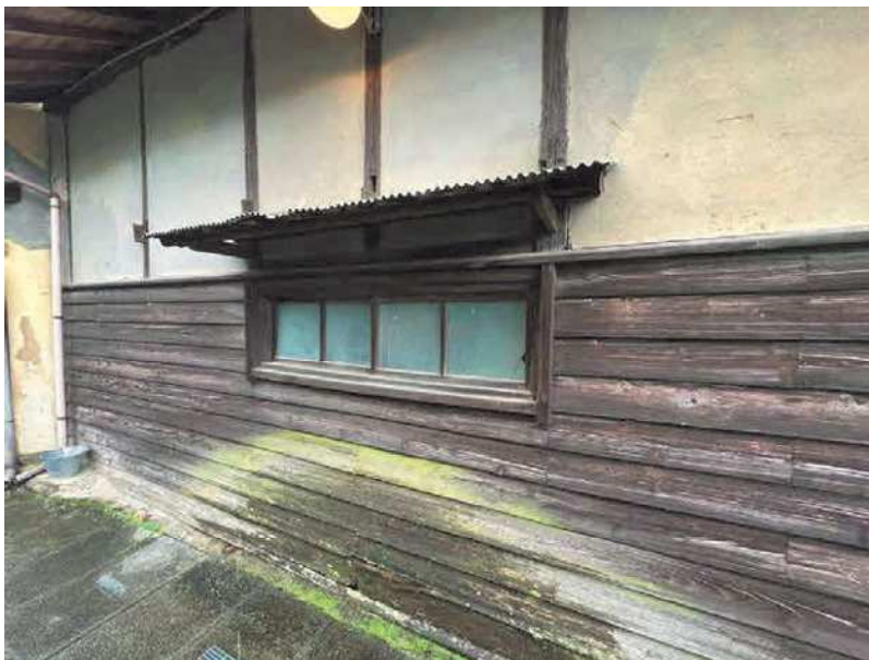
写真No10 撮影日：2022年7月4日