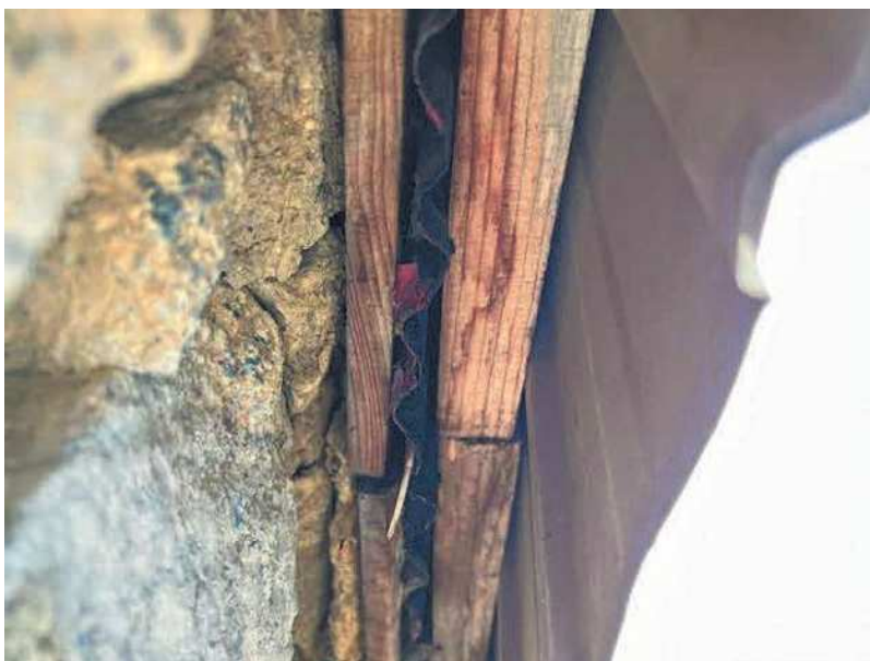
写真No12 撮影日：2022年7月4日