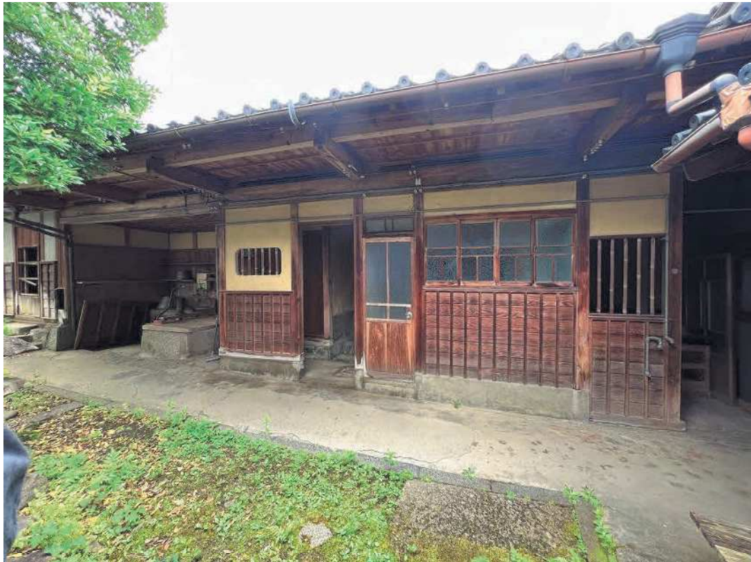
調査建物【釜場】外観写真