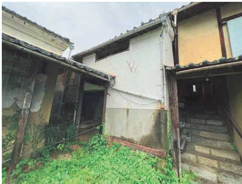
写真No1 撮影日：2022年7月4日