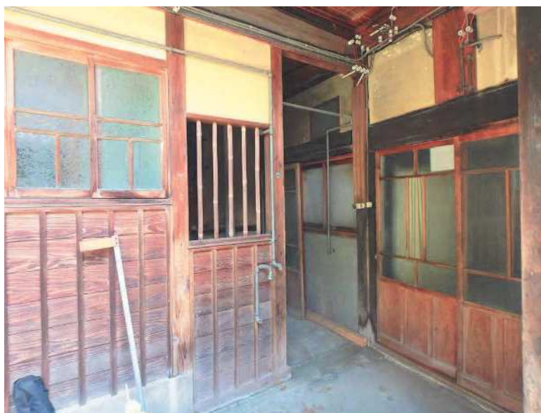
NO. 2 撮影日：令和4年6月12日