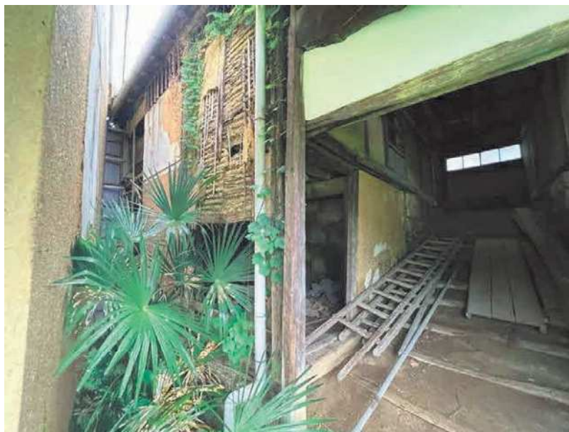
写真No2 撮影日：2022年7月4日