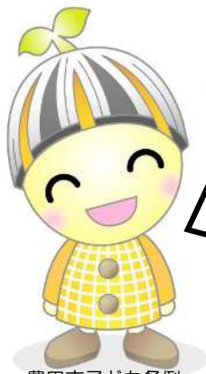
豊田市子ども条例