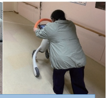
参観日ではお風呂（特殊浴槽）と歩行訓練ロボット体験も行い、皆さんに大好評でした！