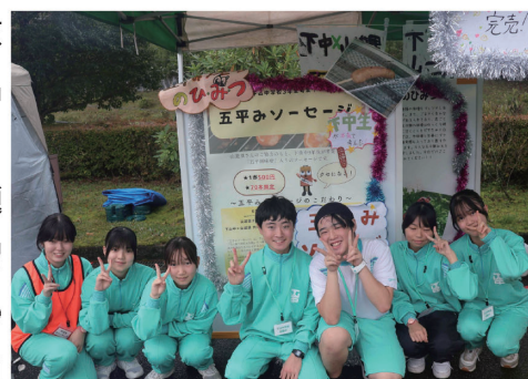
▲しもやまスマイルフェスタの様子

下山中学校では、下山地区が抱える出生数の減少など、地域の課題と向き合い、地域のためにできることはないかと考え、総合的な学習の時間で「下山魅力発信大作戦」というテーマで活動しました。その一環として、生徒たちは下山の知名度向上を目指し、話題性のある商品の販売を検討しました。山遊里の全面的なサポートを受けながら商品開発に取り組み、下山ならではの特産品を使ったアイデアを出し合いました。候補として「ブルーベリー」と「五平みそ」が残り、試作を重ねた結果、「五平みそ」の味が最も良いと判断し、商品化したとのことです。生徒からは「五平みそだけだと甘くなりすぎるため、七味やガーリックなどの配分を何パターンか試してちょうどよい味に仕上げました。」「試食の際に想像以上においしく仕上がっていたことがとても嬉しかったです。」とのコメントをいただいています。5月末まで販売予定です。好評であれば販売期間が延長されます。ぜひご賞味ください。