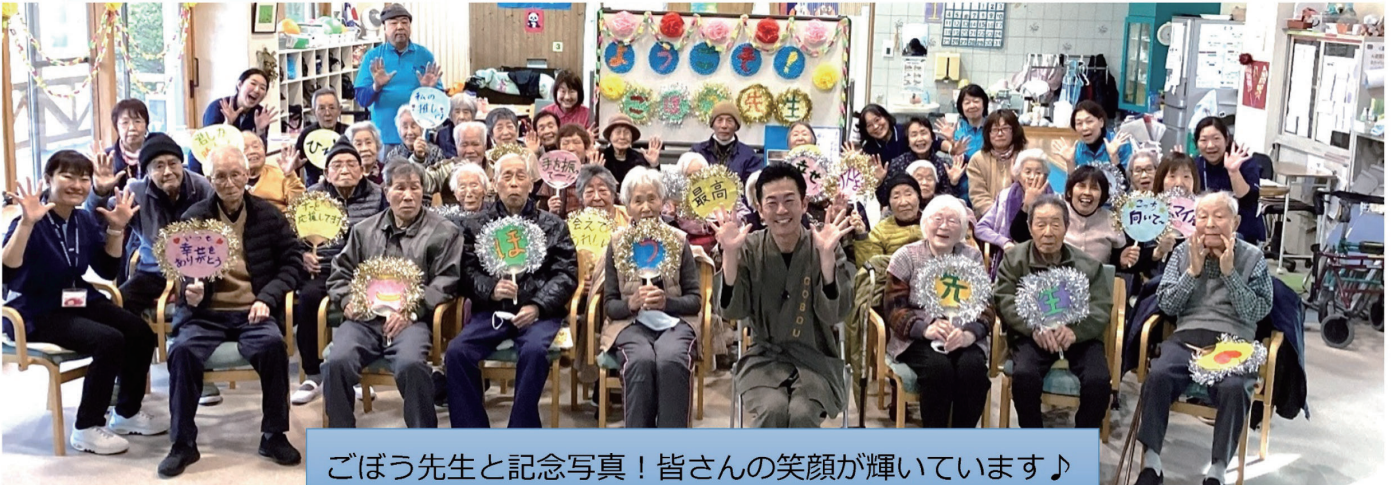
ごぼう先生と記念写真！皆さんの笑顔が輝いています♪

全国各地で大活躍の『ごぼう先生』を講師にお迎えし、介護予防や元気につながる講話・体操を行っていただきました。参加者の皆さんは、ごぼう先生の世界に引き込まれ、終始笑顔のひと時でした。