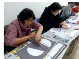
カルトナーージュで箱づくり