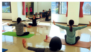
初めての床バレエに挑戦

講師を下山在住限定とし、クリエイターが親切丁寧にモノづくりの楽しさを伝えていました。また、床バレエなどは硬い体がほぐれたと好評でした。約80人の来場者があり地域特産品の販売なども楽しめました。