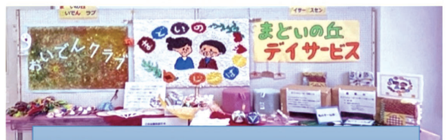
参観日では、作品展示も行いました。

デイサービスの利用者さんに人気の豆乳甘酒の試飲も実施しました。参加者の皆さんから「レシピを教えてください」と言われるくらい大勢の方に大好評でした！