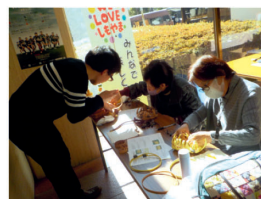
革ひもで編むかごづくり