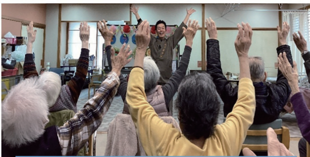
ユーモアと体操を交えた講話で会場は大盛り上がりでした。