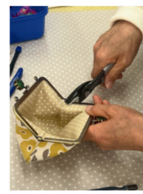
がま口ポーチづくり