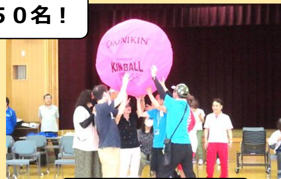
キンボール体験会