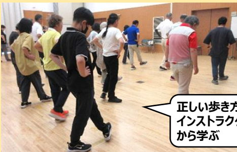
正しい歩き方をインストラクターから学ぶ

正しい歩き方を学ぶ。参加者には健康関連グッズを配布。健康チャレンジの取組に活かすために開催。