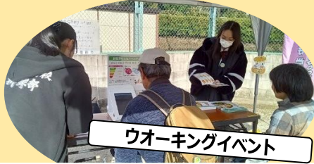
ワーキングイベント