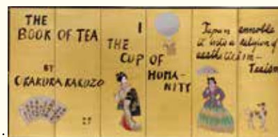
杉本健吉:画 本多静雄:書 「明治開化屏風」(左隻)1949年