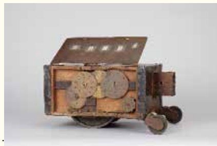
りょうていしゃ 国宝 量程車(伊能忠敬記念館蔵)