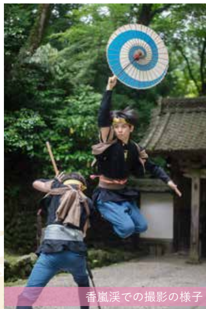
香嵐溪での撮影の様子