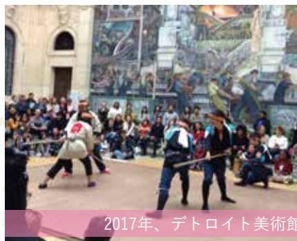
2017年、デトロイト美術館で行った親善イベントでの交流の様子