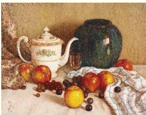
高島野十郎《ティーポットのある静物》 1948年以降、福岡県立美術館蔵

定員 先着20人(当日直接会場。「没後50年 高島野十郎展」の当日の観覧券が必要)