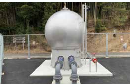
耐震性がある貯水槽に給水栓を設置した応急給水施設

大きな地震が発生すると、水道管が破損し水道が止まるおそれがあり ます。市では、特に重要な医療機関などにつながる水道管や施設の耐 震化を優先して進めています。また、応急給水施設（災害時に水が配 られる施設）の整備や他の自治体との連携により、大規模な災害時に も水道水を届けられるよう備えています。