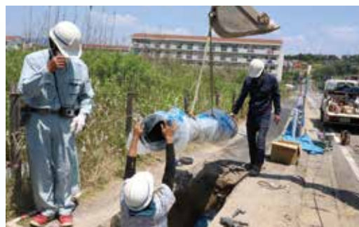
老朽化した水道管の交換作業

水道管が老朽化すると、破損によって漏水や道路の陥没、断水などに つながるおそれが高くなります。市では、皆さんが安心して水を使え るよう、地中の水道管の状態を調べ、計画的に更新を進めています。