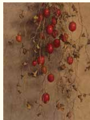
高島野十郎《からすうり》 1935年、福岡県立美術館蔵