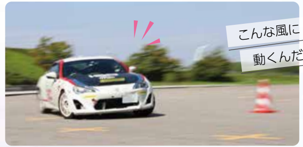
こんな風に動くんだ！