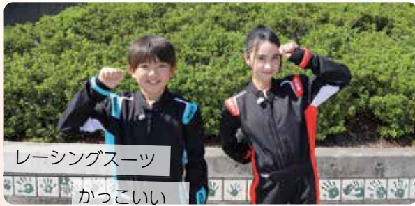
レーシングスーツ