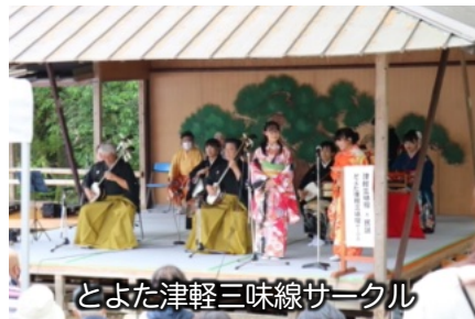
とよた津軽三味線サークル