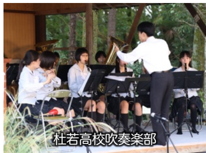
杜若高校吹奏楽部