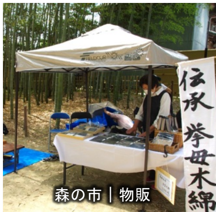
森の市 | 物販