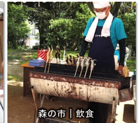
森の市 | 飲食