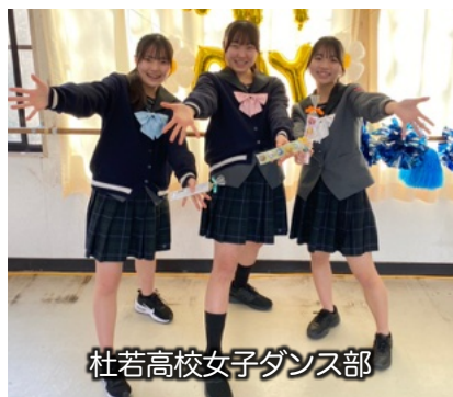
杜若高校女子ダンス部