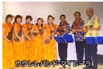
ウクレレバンド マイレーラ