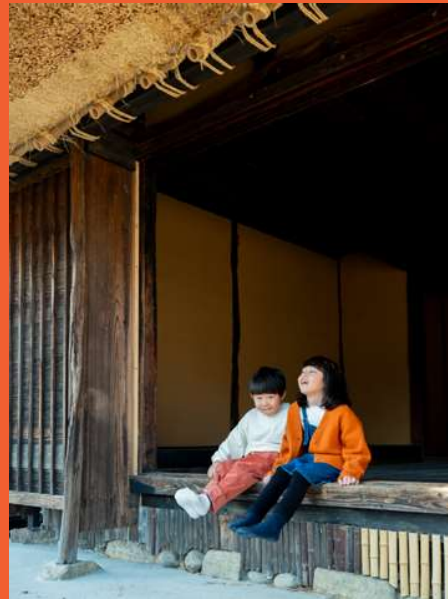
むかしの家[旧平岩家住宅](市指定文化財)