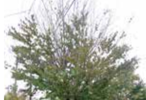
カツラ被害木 上部から枯れている