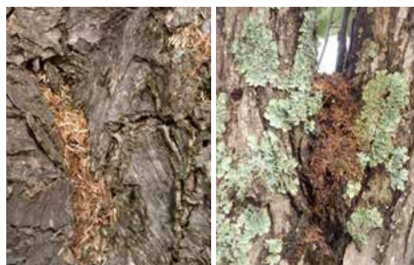
ツヤハダゴマダラカミキリのフラス

ツヤハダゴマダラカミキリは、知らない間に地域に入り込んでしまいます。見た目が在来のゴマダラカミキリに似ているため、成虫を見ても外来種だとは気づけず、沢山の木が同じように弱ってきて、ようやく、この虫の侵入のためだと判明することがよくあります。まだ、日本への侵入が見つかったばかりの虫なので、木を伐らないで虫だけを取り除く方法は、まだよくわかっていません。この虫を駆除するには、成虫が木から出てくる前に被害木を伐採し、燃やすか細かくチップにするしかないのです。前述の脱出孔や産卵痕で被害木を探す以外に、幼虫が出す木屑とふんの混合物(フラス)が樹皮からこぼれ落ちることも、この虫が樹木の中にいることのサインとなります。加害が激しくなると樹皮がはがれ始めて、本種のフラスがみられるようになります。