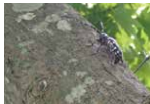
カエデ被害木 産卵しているメス成虫