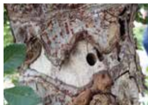
アキニレ被害木 脱出孔が樹皮の落ちた所にある