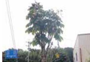
トチノキ被害木 枝枯れし樹皮が落ちている