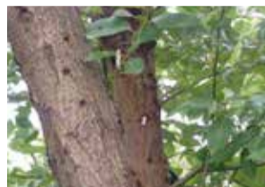
ヤナギ被害木 産卵痕と樹液浸出がみられる

ツヤハダゴマダラカミキリはさまざまな広葉樹を加害することで、世界的によく知られています。国内では、ヤナギ類、ニレ類、カツラ、サクラ、トチノキ、カエデ類の被害がこれまでに報告されています。特に被害が多いのが、アキニレ、カツラ、トチノキ、ヤナギ類で、これらの木の幹や枝にまん丸の穴があいていたら、本種がそこにいる可能性があります。