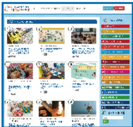
ホームページイメージ