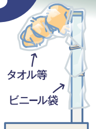
タオル等 ビニール袋

蛇口にタオルなどを巻きつけ、 ビニールテープ等で固定し、雨や 雪で濡れてしまわないように ビニール袋をかぶせましょう！