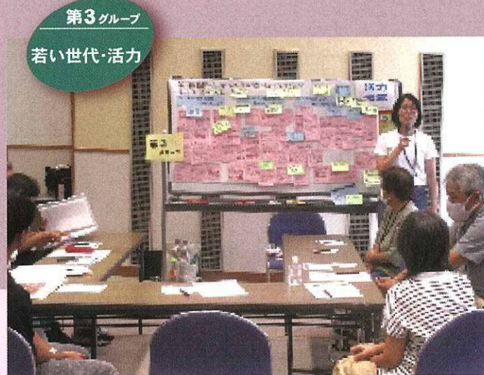
第3グループ 若い世代・活力