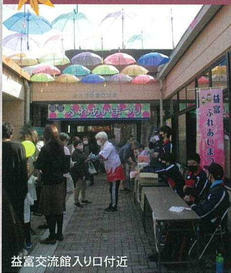
益富交流館入り口付近