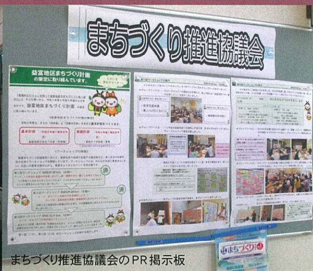
まちづくり推進協議会のPR掲示板

第37回益富ふれあいまつりが11月5日(日)天候にも恵まれ盛大に行われました。「益富地区まちづくり推進協議会」では、1階通路の掲示板に益富地区まちづくり計画の取組の概要と、7月30日と9月24日に行われた、第1回と第2回のワークショップの様子を写真と記事で紹介しました。益富地区の方々に、これからの活動に対してご理解とご協力をお願いした内容の展示をいたしました。