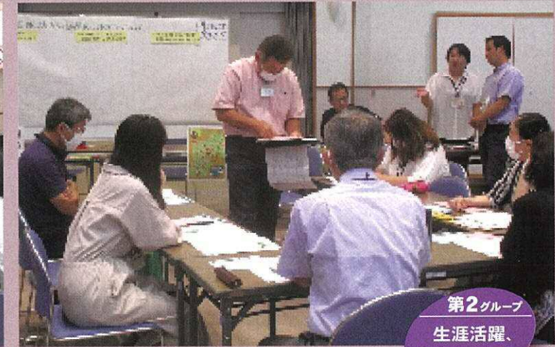
第2グループ 生涯活躍、安全・安心A