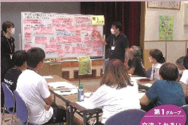
第1グループ 交流・ふれあい