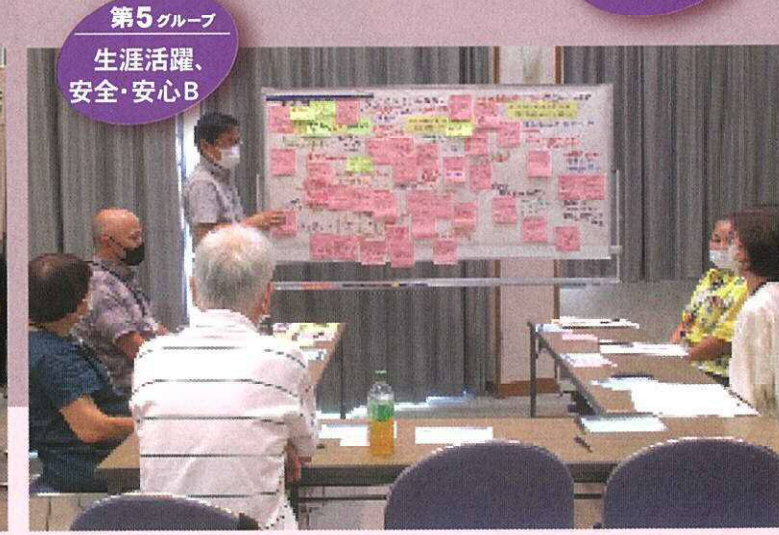
第5グループ 生涯活躍、安全・安心B

益富まちづくりワークショップ参加団体(順不同) .....多くの方々に参加いただきありがとうございました。