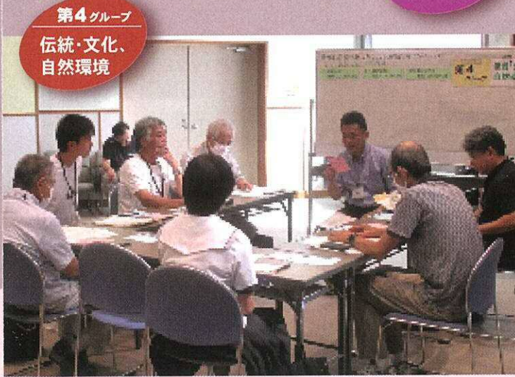
第4グループ 伝統・文化、自然環境