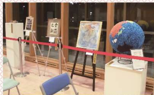
▲昨年の優秀作品の展示 (豊田市役所 東庁舎1階ロビーにて展示)

審査員によって選ばれた 5賞の作品 を展示します。 ぜひこちらにもお越しください！