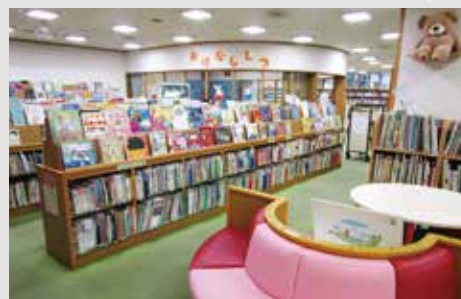
児童コーナーも充実!