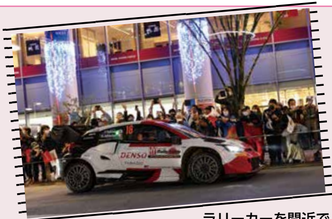
ラリーカーを間近で見られる！(右表①)