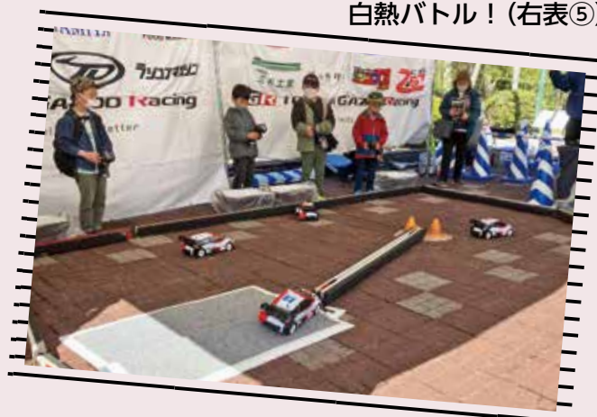
ラジコンで白熱バトル！(右表⑤)