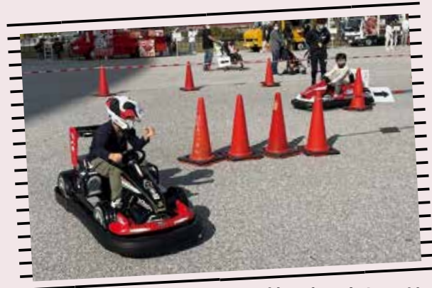
サーキットレーサーになりきろう！(右表⑥)