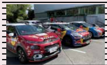
ラリーカーがずらり！(右表③)