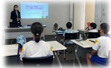
【心のバリアフリー推進講座】