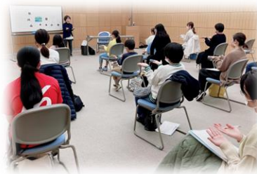
【市民向け体験講座（手話）】