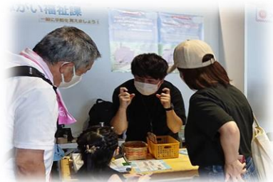
【市民啓発活動（産業フェスタ）】