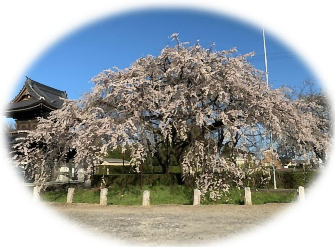
行福寺のしだれ桜