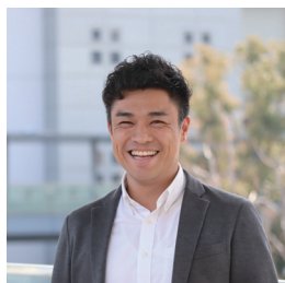
NPO法人G-net 理事 採用・就職支援事業担当