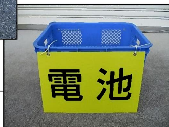
リサイクルステーションのかご