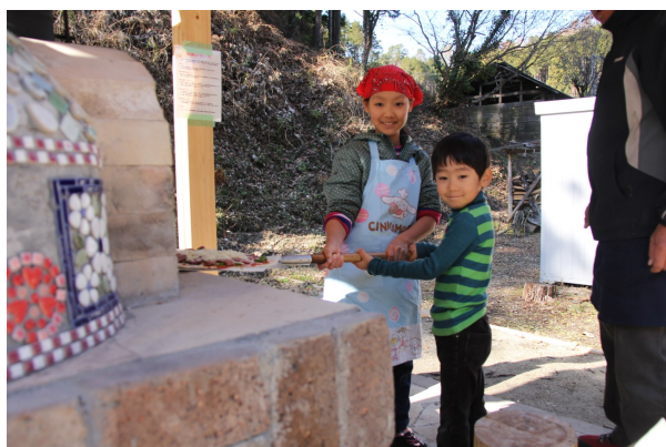
昨年の交流会の様子 (すげの里の石窯でピザを作りました)