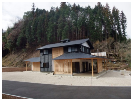
里山暮らし体験館 すげの里