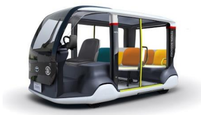
<園内移動モビリティ外観イメージ>

・トヨタ紡織株式会社：関連機器を搭載した園内移動モビリティ及びコンテンツの提供 実証実験の効果検証