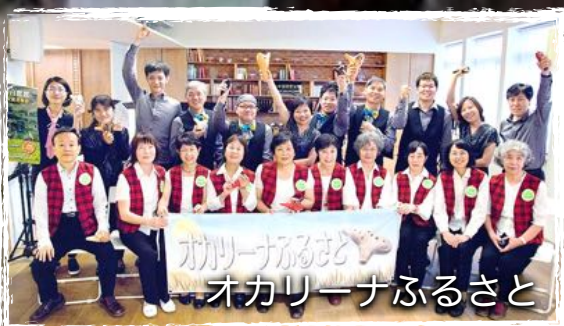
オカリーナふるさと オカリーナふるさと