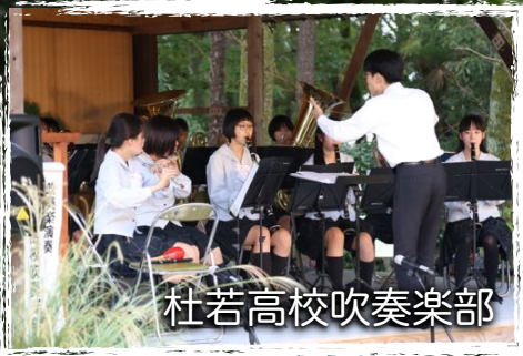
杜若高校吹奏楽部