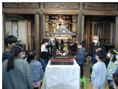
▲甘茶をかける様子