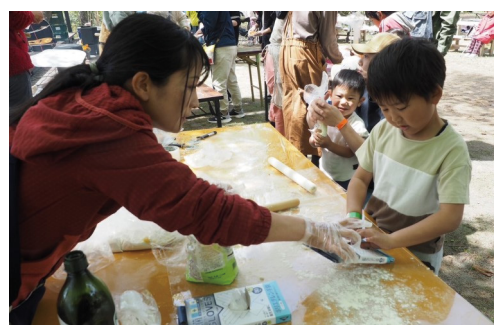
▲みんなが楽しめるピザ作り