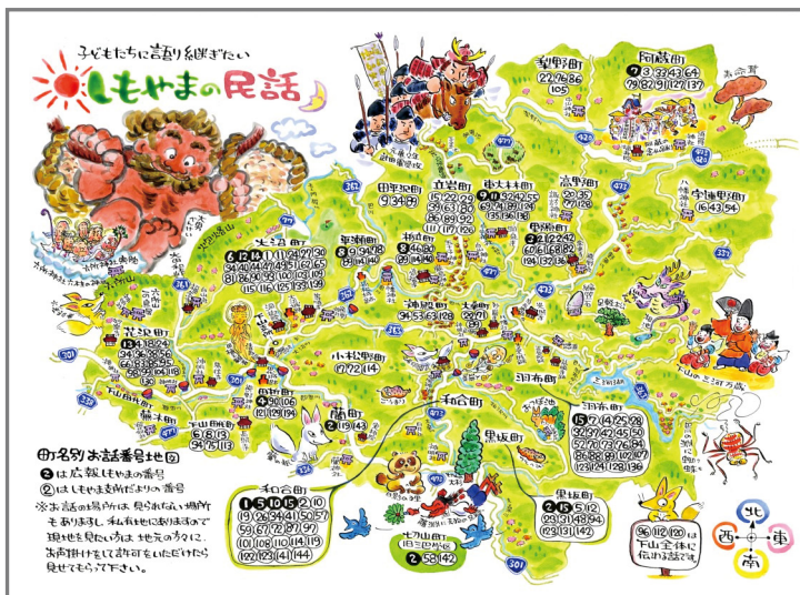
▲民話の位置を示した絵地図