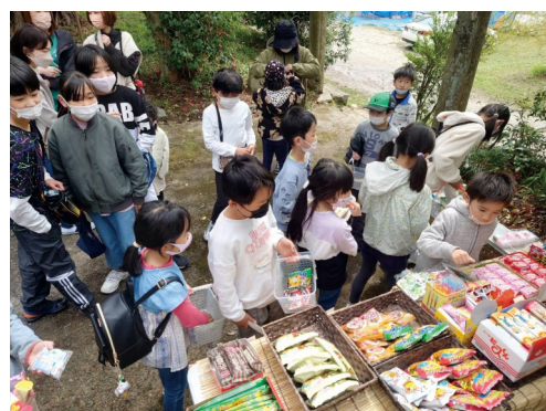
▲駄菓子屋でお菓子を買う子どもたち