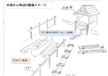
▲区長さん手書きの完成イメージ図

地区外から来られる方が、地域貢献活動にスムーズに入っていける背景にはこのように入念な準備、段取りなど“地元の力”があることを忘れてはなりません。