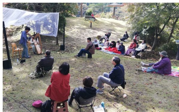
▲思い思いのスタイルでゆったりした時間を楽しむ来場者