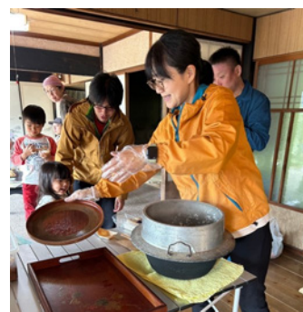
▲新米試食会の様子