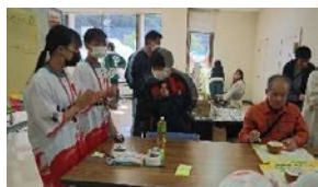
▲中学生ボランティア