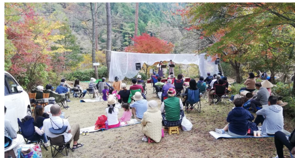
▲2日間で110人を超える方にお越しいただきました