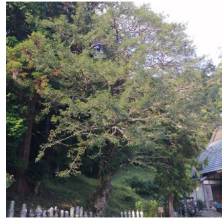
▲東大林町のカヤの大木

東大林町の大カヤは、どーんと大きな存在感で、お寺本堂の横に屹立（きつりつ）していました。その太さ1m、高さ18m程度。この木の枝葉は南側市道のオープン・スペースに向かって伸びやかに広がり、大きな樹冠を形成しています。幹からの枝先までの距離が10mもある太い枝もあり、それらは枝先が重いのか、スケートのイナバウアーのように枝が反り下がる形をしていました。枝先まで緑色の苔がびっしりと付いて、山間地域で、長い歳月を積み重ねてきた老木の雰囲気感を漂わせています。近くの里山で、皆さんもカヤの木を探してみてください。