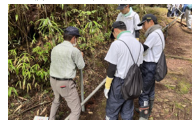
▲安全を最優先に手順を説明