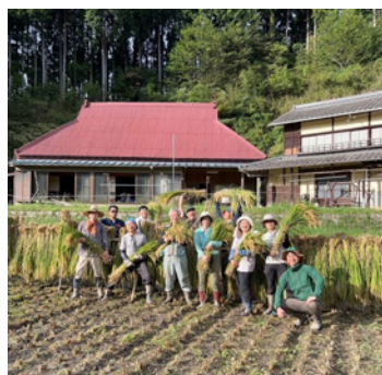
▲稲刈りしたときの様子