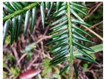
▲カヤの木の葉。触ると痛い。