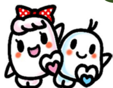
カラーボーリング