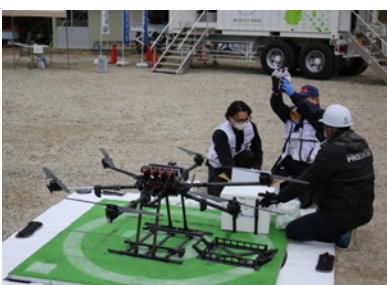
▲ドローンから医療品を取り出す様子