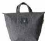
カバン型コンポスト