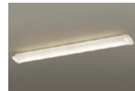
⑥キッチンベースライト