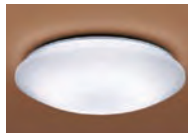
①シーリングライト