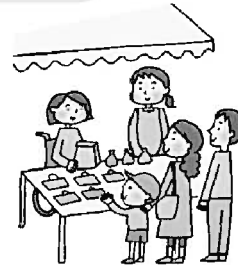
地域のお祭りやイベントに参加する。