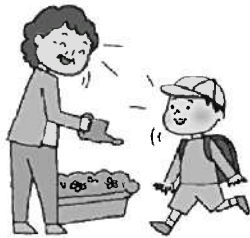
地域であいさつをする。