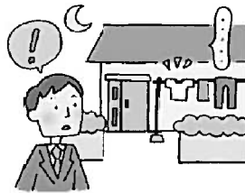
近所の一人暮らしの高齢者を見守る。