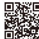
認証キーの取得方法 発注者への提出方法