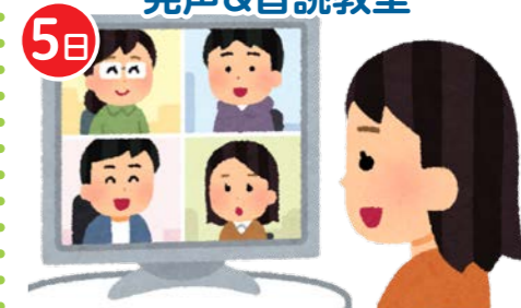
JTBコミュニケーションデザイン