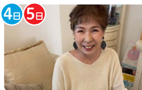
メナードフェイシャルサロンムウブランジェ