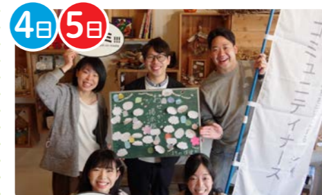
Community Nurse Company