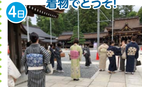
PIPO編集室 プラネッツ豊田