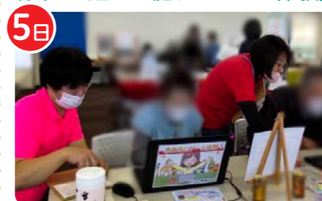
パソコン教室みんと