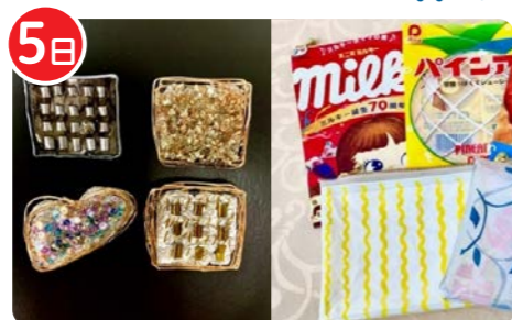
豊田中日文化センター