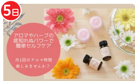
アロマセラピーの会Rapha