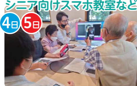
SMIRING(クラブスマイリング)