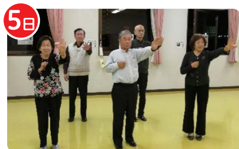
トヨタ生協 カルスポ