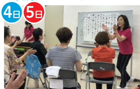
とよたミュージックケアの会