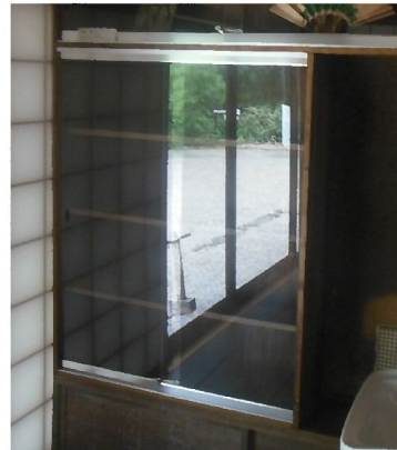
アクリルケース（中）