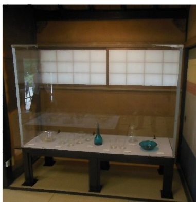
アクリルケース（大）