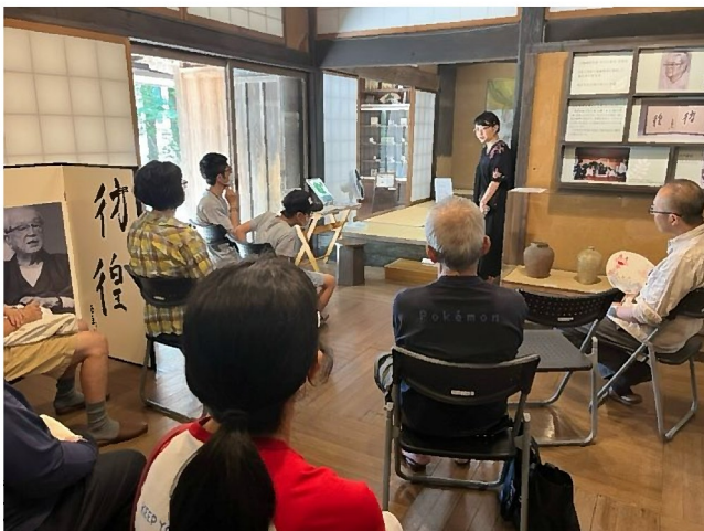
作家によるギャラリートーク（展示解説）