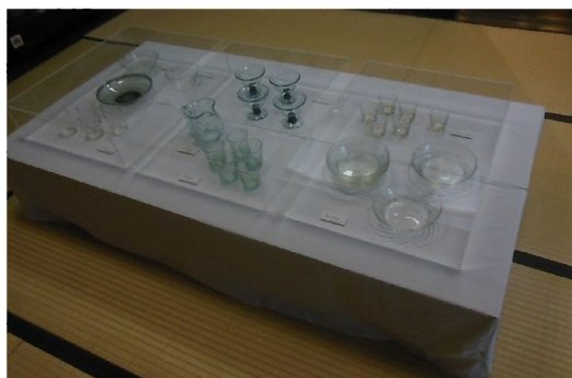
アクリルケース（小）