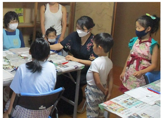
作家によるワークショップ