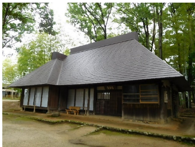
豊田市民芸の森 田舎家