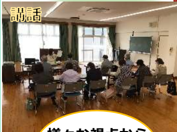
インボディで身体測定