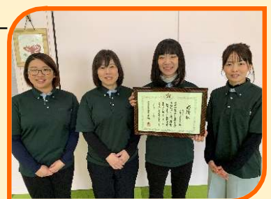
まどいの丘包括支援センター