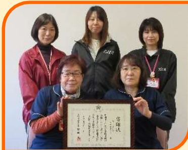
ぬくもりの里包括支援センター