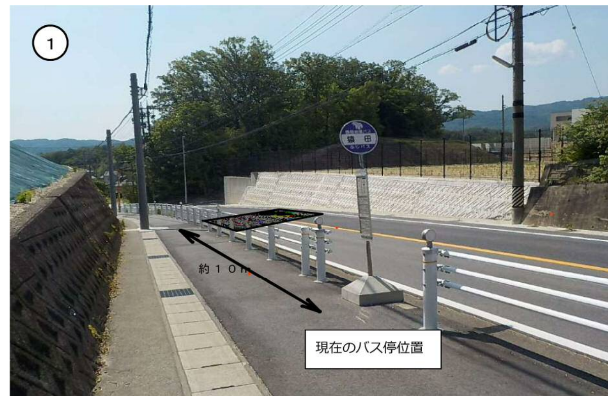
横断歩道設置予定箇所