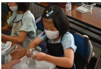
まが玉をつくっている様子

この講座では、まが玉をつくる体験だけでなく、豊田で出土し、郷土資料館に展示してあるまが玉を見ながら古代について学ぶことができます。