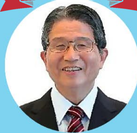
ふじしま あきら 藤嶋 昭氏

不思議だと思うことを図書館などで調べ、まとめてみると、素晴らしい達成感を味わうことができます。自信もつきますし、さらに広く深く調べようとの意欲がわいてきます。まずは始めてみましょう。