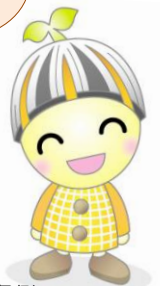
子ども条例 マスコットキャラクター 「チルコ」

【問い合わせ】 豊田市役所子ども部次世代育成課 青少年担当 〒471-8501 豊田市西町3-60 電話: 34-6630 FAX: 34-6938 E-mail: jisedaiikusei@city.toyota.aichi.jp