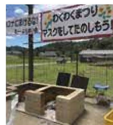
▲防災かまどベンチ