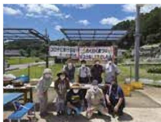
▲団体の活動の様子

整備し、体験イベントを実施しました。今後もイベントを通して地域内交流を図ります。他の地域の方にも利用していただきたいと思っていますので、是非遊びに来てください。