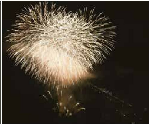
▲ダムの堰堤と花火

8月27日（土）、豊田市しもやま観光協会が三河湖で花火大会を開催しました。今回は、シャトルバスの運行などイベントの実施方法の検証を目的に、地区住民限定で行いました。当日、三河湖観光センターや羽布ダムなどに多くの住民が訪れ、目の前で打ち上げられた迫力満点の花火を楽しみました。