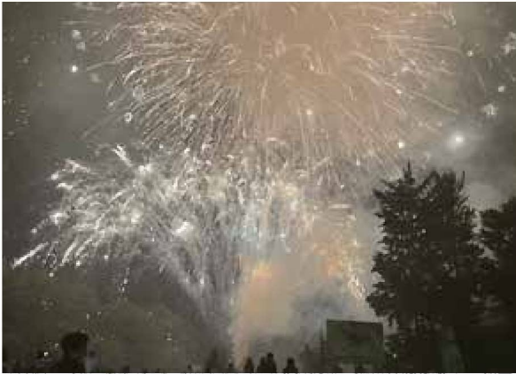
▲三河湖観光センターから撮影した花火