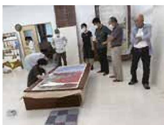
▲愛知県立芸術大学で行った修理の様子

愛知県立芸術大学と協力し、須賀神社の襖絵を修理しています。専門家に見てもらい、7枚の襖で構成されると思っていた襖絵が、実は8枚で当初は作られていたと分かり驚きでした。襖絵を背景に三番叟を披露するため、練習に励みます。