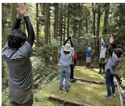
▲森林セラピー体験会の様子