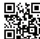
▲豊田市公式Youtubeチャンネル ( https://youtu.be/GscMuMJFGqs )