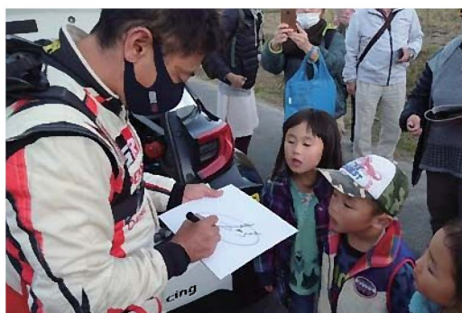
▲セントラルラリー2021の様子