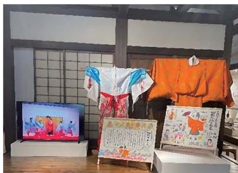
▲「下山村の三河万歳」特設コーナー