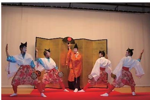
▲下山三河万歳保存会の演舞