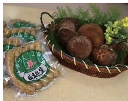
▲新商品のソーセージ