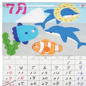
創作活動(カレンダー)

その他の活動として、レクリエーション(ゲーム)や運動会、外出などの活動も行っています。