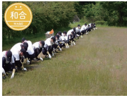
▲和合自治区・社協 まどいの丘の環境整備