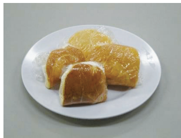
クリームワッフル