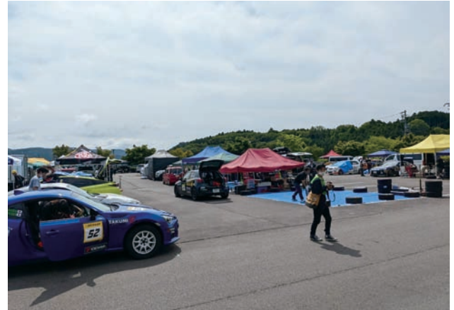
▲サービスパークとなったまどいの丘

6月19日（日）、羽布町、和合町ほかで「豊田しもやまラリー2022」が初開催されました。