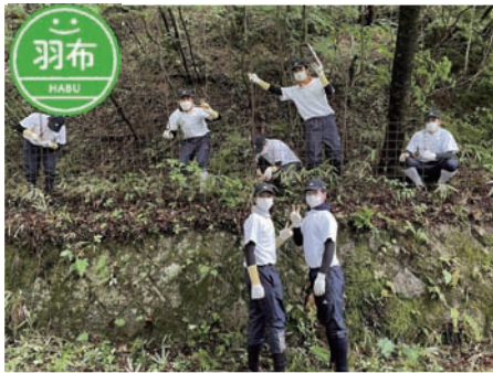
▲羽布自治区 獣害柵の移設作業等

大沼自治区： 旧大沼小学校跡地の環境整備 大沼こども園：柵のペンキ塗り 羽布自治区：獣害柵移設 東部こども園：側溝清掃