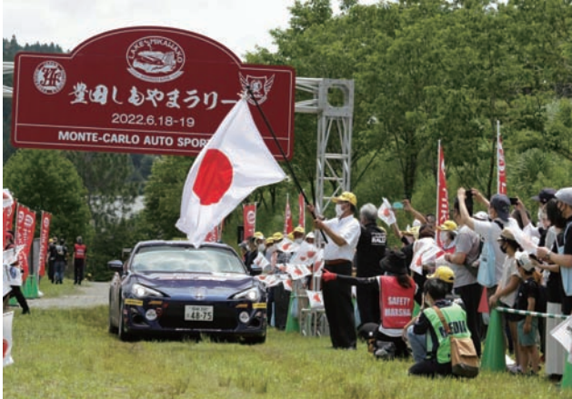
▲セレモニアルスタートで声援を送る観戦者