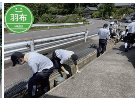
▲東部こども園 側溝の清掃等