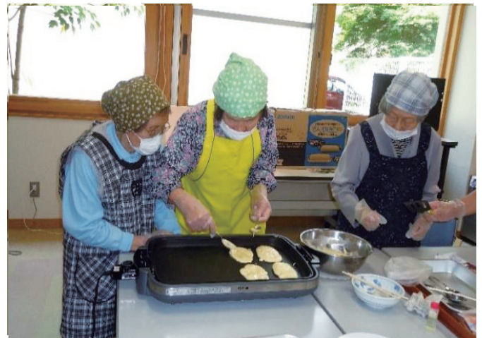
おやつ作りの様子