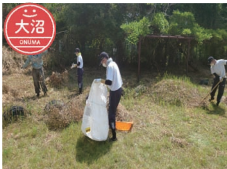
▲大沼自治区 旧大沼小学校跡地の環境整備