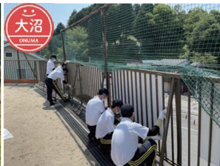
▲大沼こども園 柵のペンキ塗り等