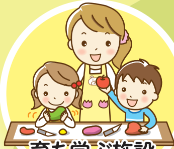
育ち学ぶ施設 (学校、こども園など)