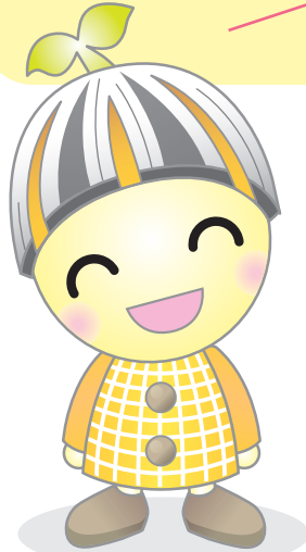
豊田市子ども条例 マスコットキャラクター チルコ