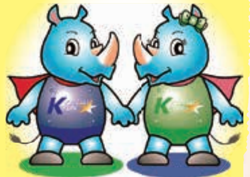
キュウサイくん キュウサイさん

こことよは、子どもの権利が侵害されたとき、その救済と回復をはか はか るために設置された公正・中立な公的第三者機関です。子どもから話を聴き、一緒に考え、解決を目指していきます。保護者から そ の相談も受け付けています。