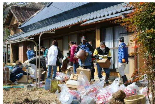
▲地域による空き家片付け大作戦