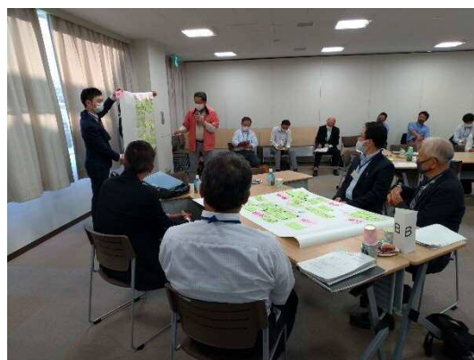
▲委員による発表の様子