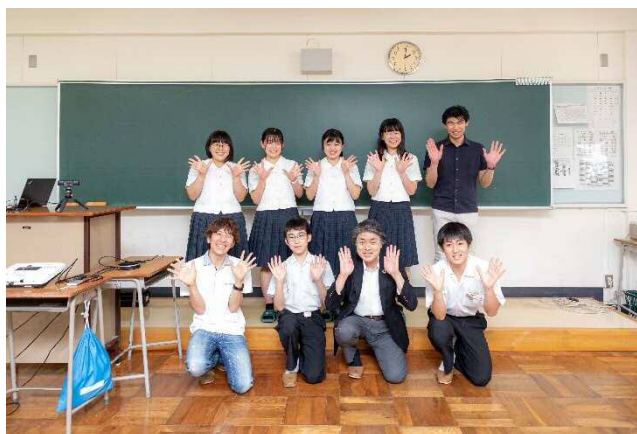
▲ 中高生との意見交換