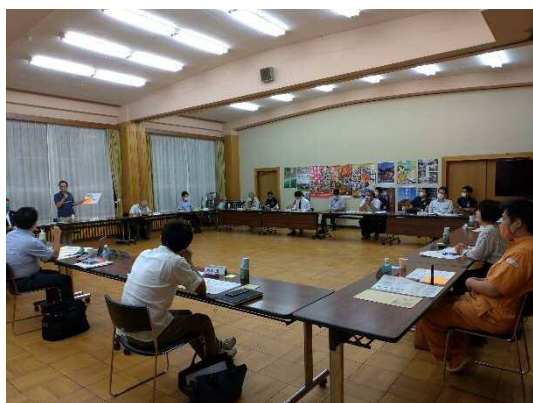
▲第1回市民検討委員会の様子