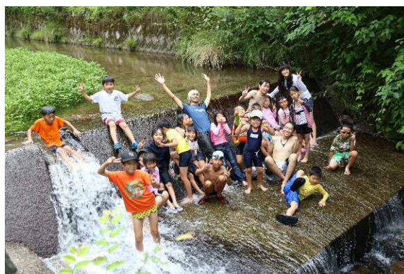
▲自然環境を楽しむ子どもたち