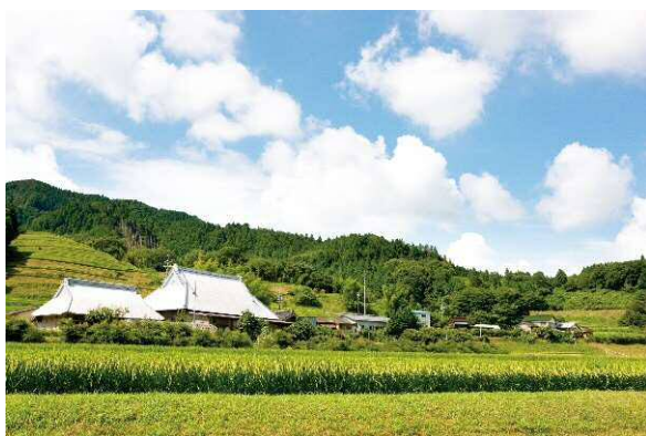
▲山村地域の原風景