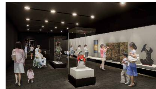
コレクション展示室