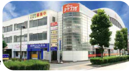
ハートプラザ外観

ハートプラザ 生協会館1階 豊田市御幸本町4丁目200-1 ☎0120-278-122 📍 停留所: 200_生協会館ハートプラザ