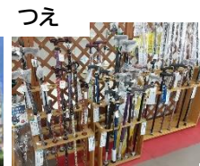
介護用品の 販売とレンタル ご紹介