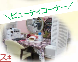
\\ビューティコーナー/