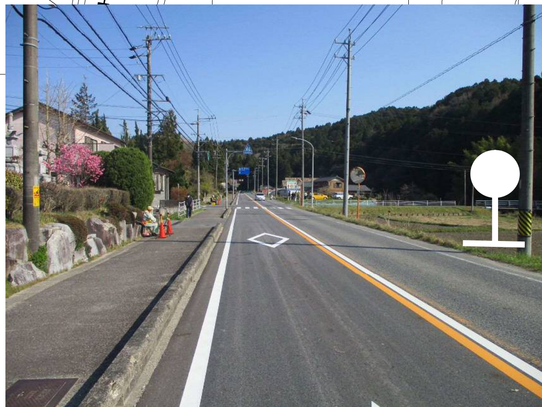
バス停移設先 (写真方向①)