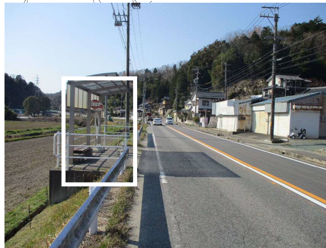
現在バス停 (写真方向②)