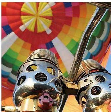
▲熱気球を見上げた様子