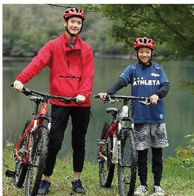
▲マウンテンバイク