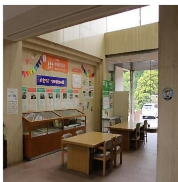
▲交流館1階 ロビースペース

施設のバリアフリー化整備工事を以下の日程で行います。そのため、工事期間中は、下山交流館のトイレやロビースペースなどが一部使用できません。